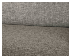
+ Tapicerka Portobello *