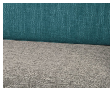
+ Tapicerka Clipper