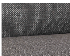
+ Tapicerka Floyd