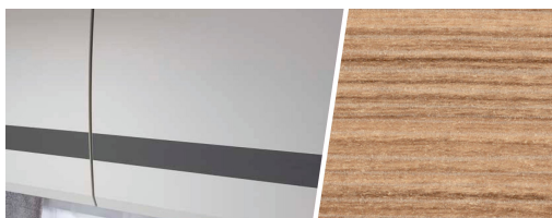
+ Elementy dekoracyjne z drewna Rosario Cherry