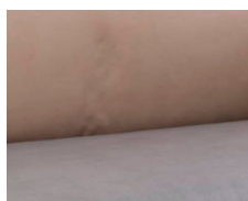
+ Tapicerka Duke *