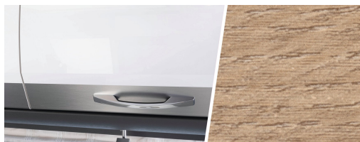
+ Elementy dekoracyjne z drewna Amberes Oak