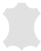
+ Skóra naturalna Individual *