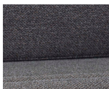
+ Tapicerka Melia *