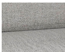
+ Tapicerka Samir