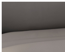
+ Tapicerka ze skóry naturalnej Collin *